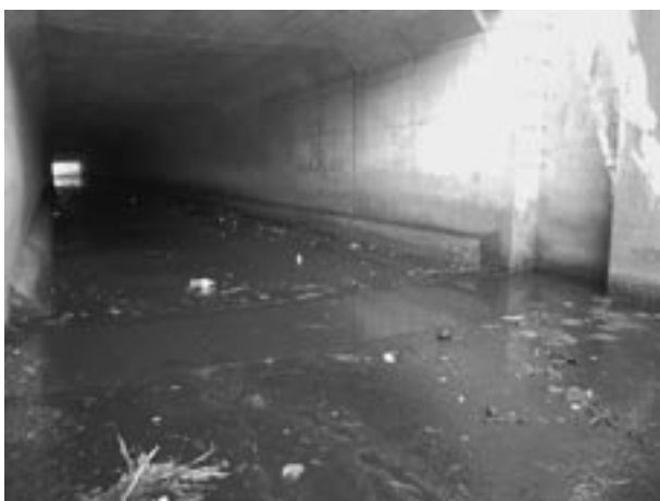
図2 採集場所の様子

体は円筒状で，肛門より後方は側扁する。腹鰭は癒合せず，左右一対ある。眼の後方から鰓蓋に向かって斜め下後方にのびる 3 本の赤褐色縦帯がある。鰓蓋後方から尾鰭基底部の体側中央には 8 個の赤褐色斑紋が縦列する。頭部感覚管開孔は，前鰓蓋管 N'，O' がある。同属のゴシキタメトモハゼ O. sp. 1 の特徴である体腹側の黒褐色縦線，臀鰭の黄色縦帯，眼の上縁の 2-3 列の小鱗（鈴木ほか，2006）はみられない。以上のように，調査標本は明仁ほか