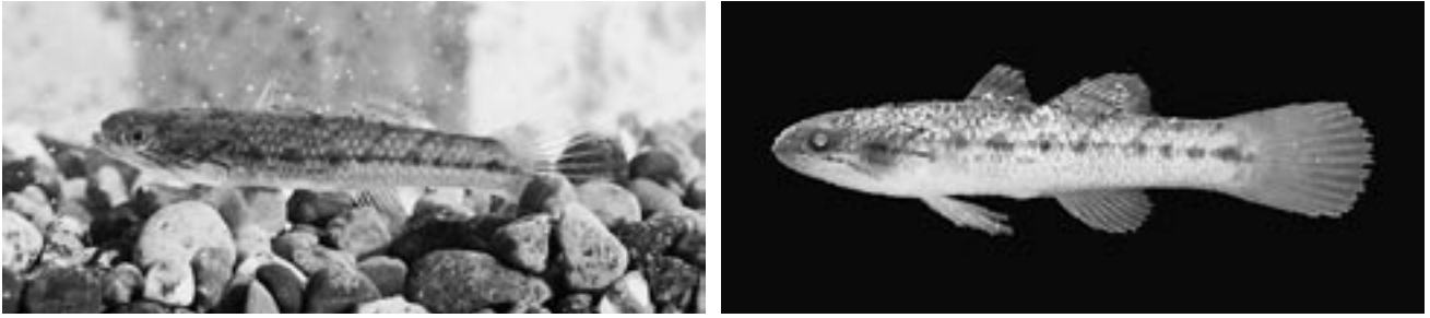
図3 タメトモハゼ Ophieleotris sp. A SPMN-h-700021 (全長 29.0mmTL, 体長 24.0mmSL) 左:生体 右:標本

(2000), 岩田 (2001), 瀬能ほか (2004) のタメトモハゼの特徴と概ね一致した。また、タメトモハゼの成魚は岩田 (2001) と瀬能ほか (2004) では全長 25 ~ 35cm, 明仁ほか (2000) では体長 14 ~ 20cm とされることから、採集された個体は未成魚と判断された。