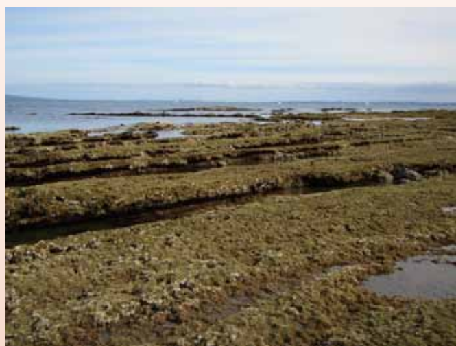
写真1 ニオガイ科の二枚貝を採集した干潮時の海岸