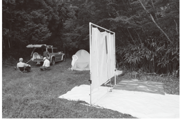
突先山の夜間昆虫ライト調査