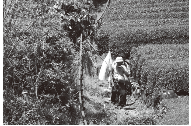
満観峰の昆虫調査