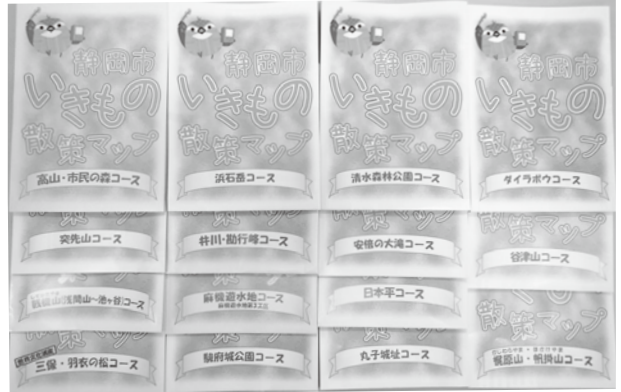
今までに出たいきもの散策マップ

ヤマビルに悩まされたりと、調査に苦労することも多かったのですが、基礎的な調査の積み重ねは、それぞれの場所の生態系保全などに、これからきっと役に立つことと思っています。また、この調査の中で撮影された写真も多数にのぼり、貴重な資料となっています。