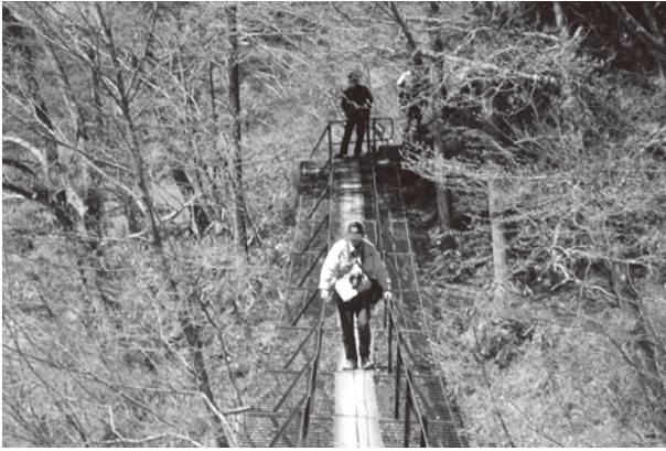
安倍の大滝の調査