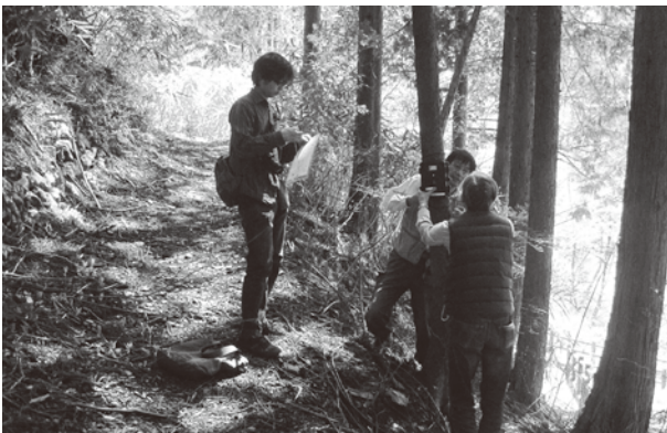
自動撮影カメラの設置