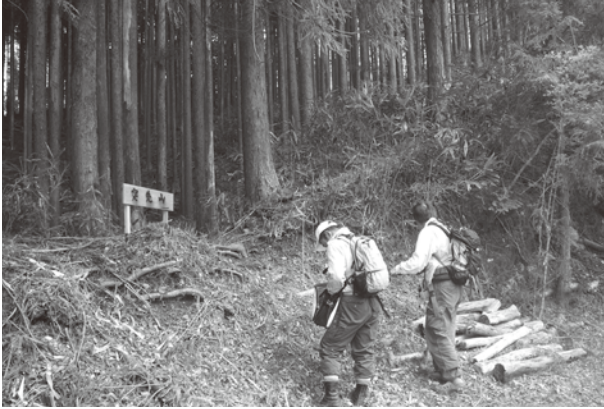
突先山の植物調査