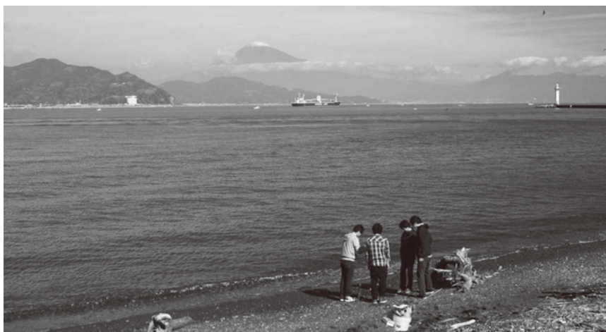
写真1：三保・真崎海岸における間隙性動物の調査風景

れまでに全世界から 20 門を越える極めて多様な動物相が報告されている。もっとも目につくのは、線形動物と節足動物で、前者はいわゆる線虫、ハリガネムシといった仲間であり、後者はエビやカニ、ミジンコ、ダニなどの仲間である。このほかにも環形動物、軟体動物、棘皮動物、刺胞動物なども見られる。つまり、ミミズ・ゴカイ、貝、ウニ・ヒトデ、クラゲ・イソギンチャクの仲間が、各々いわば