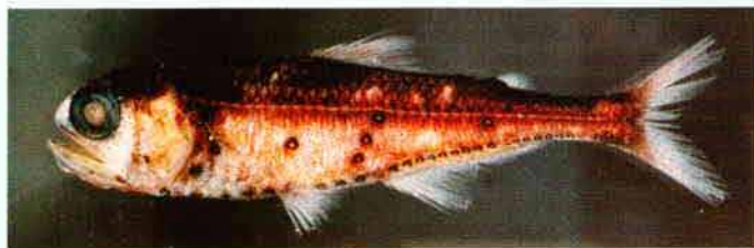
図1 ススキハダカ 体長68.5mm, 雌、駿河湾産