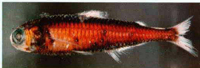
図2 アラハダカ 体長67.0mm, 雄、駿河湾産